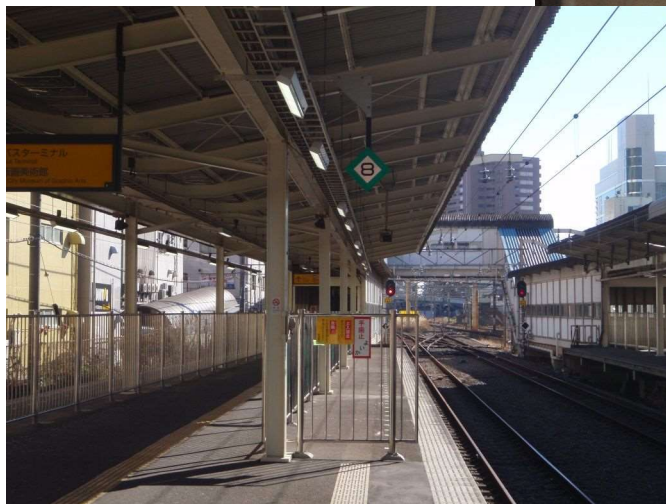
横浜方面ホーム先頭