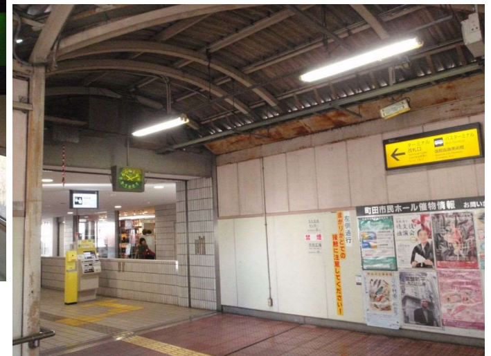
ターミナル改札口